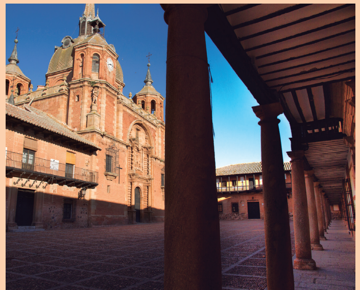
Iglesia del Santísimo Cristo del Valle, en la Plaza Mayor

La iglesia pertenece al barroco tardío de la provincia, con algún elemento neoclásico. Su planta es de cruz griega inscrita en un rectángulo. El exterior del templo está construido en ladrillo excepto en las partes nobles, en las que se emplea la piedra. Destaca su gran cúpula encamonada. La flanquean cuatro torres-campanario, con sendas figuras de simbología incierta. Tiene dos bellas portadas, la de los ladrones