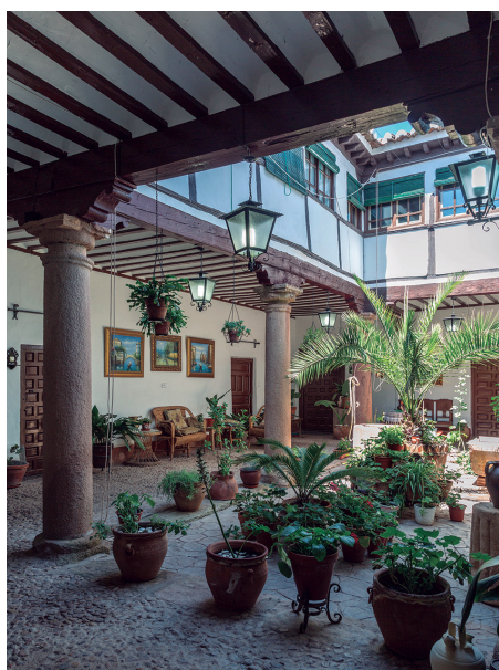
Casa del Indiano. Patio de la clase alta del estado llano

Los patios también han dejado evidencias de la desigualdad social existente en el Siglo de Oro, dividida ésta en estamentos privilegiados y no privilegiados jurídicamente, tales como nobleza, clero y estado llano. Los hidalgos aprovecharon los patios para marcar su condición nobiliaria a través de emblemas en capiteles y zapatas, así como dotándoles de un aspecto palaciego, usando para ello columnas jónicas y decorando el techo de las cajas de escalera con bóvedas de media naranja. El clero y los grupos de prestigio del estado llano, como dones y profesionales de artes liberales también se esforzaron por dotar sus casas de modestos patios peristilados. Sin embargo, ►