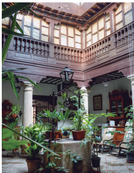
Casa del Caballero del Verde Gabán. Patio de la Nobleza