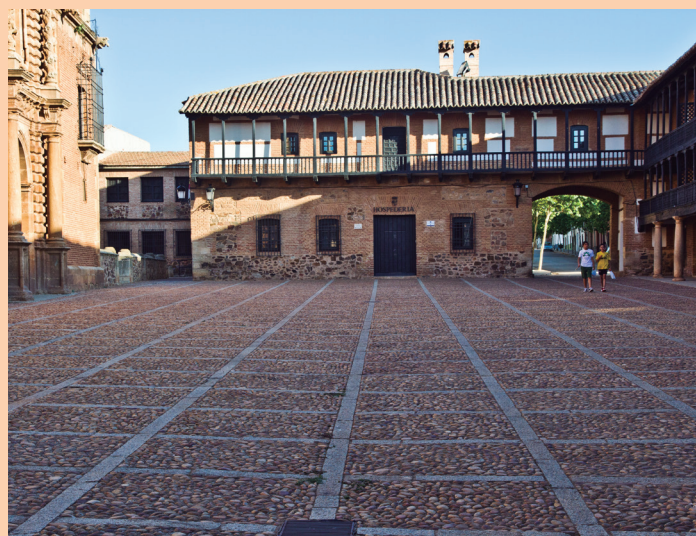
Hospedería Santa Elena, plaza Mayor

y la de Santiago Matamoros, en recuerdo a la Orden Militar a la que pertenecía el santuario. Es BIC desde 1993.