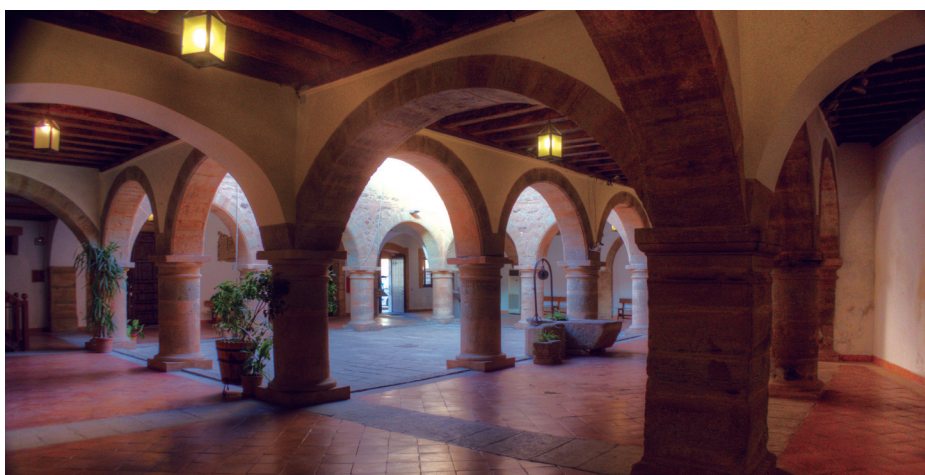
Antiguo pósito y Cárcel Real. Edificio Público

Funcionalmente, el patio era el lugar semi-público que intermediaba entre la calle y las habitaciones y aposentos. De hecho, era tradicional que estas casas, y en concreto las populares, tuvieran sus puertas de la calle abiertas durante el día. Para guardar la intimidad, los patios se escondían de la vía pública mediante zaguanes y entradas acodadas. El patio era el lugar donde relacionarse, recibir