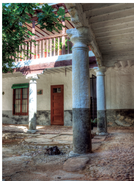
Casa de los Escuderos. Patio de la clase popular