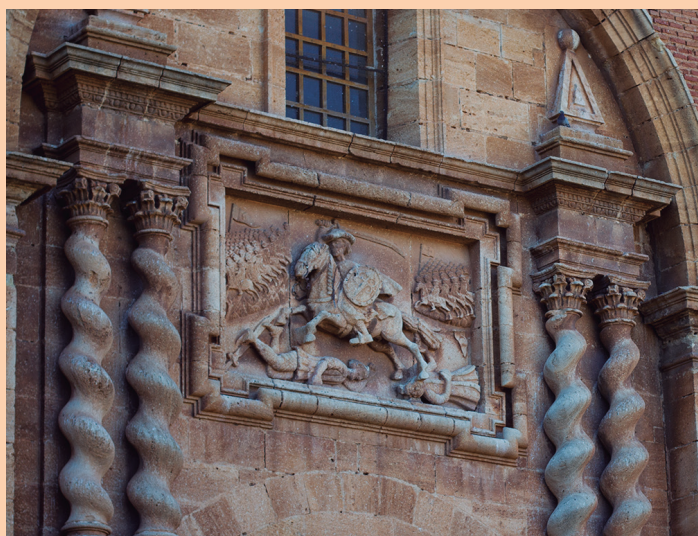
Bajorrelieve de Santiago Matamoros