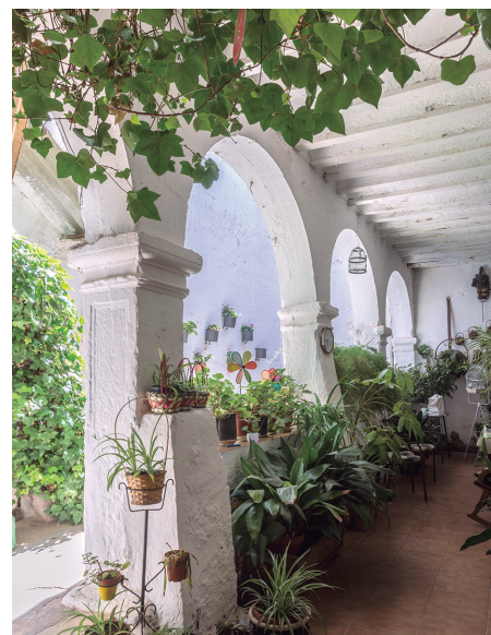
Antiguo Convento de las Franciscanas. Patio del Clero

visitas, celebrar eventos y donde las mujeres hacían tareas de costura e, incluso, de lavandería. Así, en los patios populares y en los de servicio de las casas principales no era raro encontrar un pozo y una pila. Igualmente, se solían utilizar sus muros de soleamiento para instalar galerías que, además de permitir el acceso a las habitaciones, eran aprovechadas para deshidratar alimentos y secar las coladas. En patios más complejos, estas galerías llegaban a rodear todas las bandas perimetrales. No se desperdiciaba tampoco, y especialmente en los populares, la oportunidad de formar dentro de ellos pequeños jardines con macetas, parras y algún árbol frutal u ornamental. Villanueva de los Infantes fue una de las poblaciones de La Mancha donde con más claridad triunfó la casa-patio. Esto fue debido a su emplazamiento en llano y a haber tenido su desarrollo urbano en