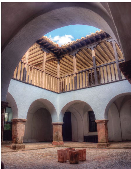
Casa de los Estudios. Edificio Público